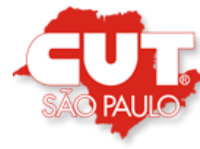
CUT – Sao Paulo Brasil